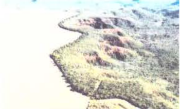
MEIO AMBIENTE Tem alta nos alertas de desmatamento