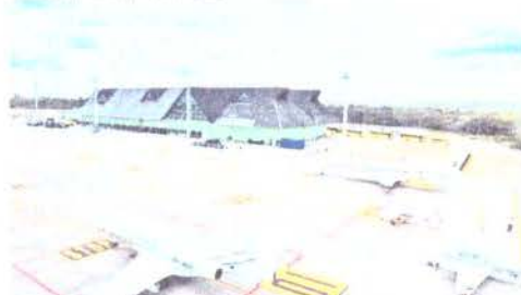
ENTRE os aeroportos nas mãos da Infraero no Ceará, o de maior movimentação é o de Jariçaranga

A Superintendência de Obras Públicas do Estado (SOPE) retomará a gestão dos dez aeroportos regionais que estavam sob gestão da Infraero. A decisão vem após a estatal federal solicitar a rescisão do Contrato de Gestão no dia 15 de fevereiro. O órgão faz a contratação emergencial para a continuidade do serviço. É o desejo de um plano que se arrastava desde o ano passado.