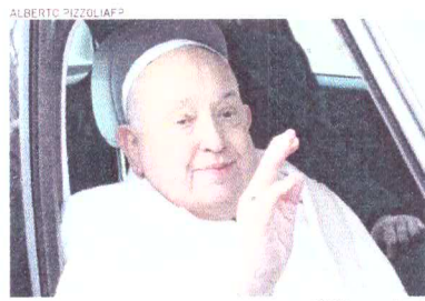
PAPA cancelou compromissos até domingo

IVATICANO | Jesuíta de 88 anos foi internado no hospital Gemelli de Roma por uma "infecção polimicrobiana das vias respiratórias" que causou preocupação