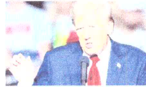
DONALD Trump, presidente eleito dos EUA I

Ela vem de longe, desde 1955, quando o casal Bill e Hillary Clinton entrou na Casa Branca. Jogaram bruto e enriqueceram. Ele tem a maior marca no indústria dos perdões. Aliviou 450 condenados, inclusive o próprio irmão. O casal acumulou tamanho poder que conseguiu neutralizar a influência de Barack Obama no partido.