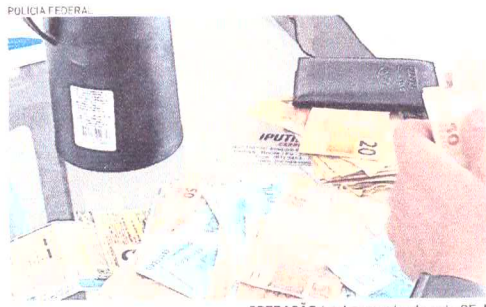
OPERAÇÃO foi desencadeada pela PF em quatro estados; dinheiro foi apreendido

Em março de 2024, dez meses depois do homicídio, uma fotografia de 34 anos foi presa, em Jaboa-tão dos Guararapes, acusado de ter sido o autor dos disparos. Sua identificação teria sido possível, à época, por imagens de câmeras de segurança. A identidade do suspeito não chegou a ser divulgada e ele não teria envolvimento anterior com crimes.