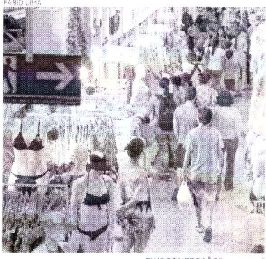
SINDCONFEÇÕES projeta que consumidor vai pagar mais