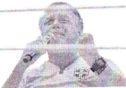
É DUVIDOSO SE saldo é bom para Bolsonaro