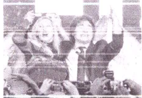
O CANDIDATO Javier Milei

A encenra argentina é séria, mas não é inédita. Lá, o general Jorge Rafael Videla, ditador depois em 1981, morreu num banheiro da cadeia em 2013. Em 2001, o presidente civil Fernando de la Rúa fugiu da Casa Rosada, e em duas semanas o país teve cinco presidentes.