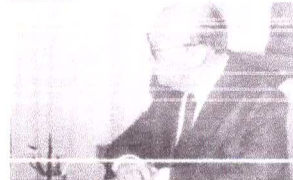
EX-PRESIDENTE General Figueiredo