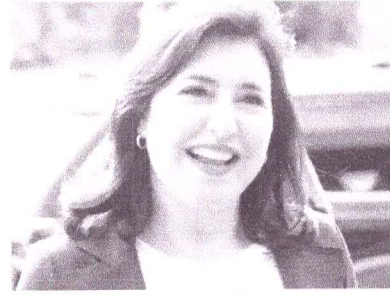
SIMONE Tebet foi candidata à presidência pelo MDB

A senadora Simone Tebet (MDB-MS) aceitou o convite do presidente diplomado Luiz Inácio Lula da Silva (PT) para ser ministra do Planejamento. O anúncio foi feito ontem pelo deputado Alexandre Padilha (PT-SP), futuro titular da Secretaria das Relações Institucionais. Ele negou, porém, que Lula tenha discutido com Tebet "turbinas" o ministério para o comando da senadora.