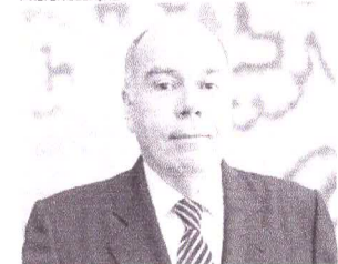
MAURO Vieira ser ministro da Relações Exteriores do governo Lula

Eu impedi que as bruxas entrassem no Itamaraty. Numa época em que se cassavam servidores aos lotes, limitei o expurgo a meia dúzia. Isso num regime de exceção.