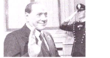
SILVIO Berlusconi morreu ontem, aos 86 anos