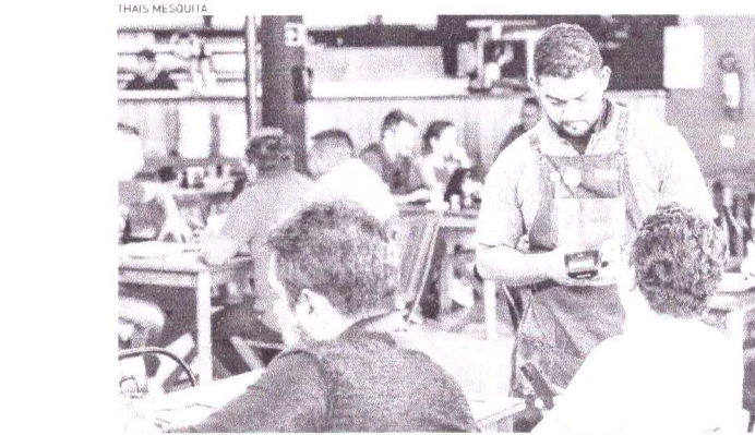
SETOR de serviços liderou geração de postos

De acordo com o levantamento em outubro, foram 44.062 admissões e 39.157 demissões. O setor de serviços é o que está impulsionando a geração de empregos no Estado, com 4,6 mil novas vagas criadas em outubro. Em seguida, aparece o setor do Comércio (1.056 vagas), Construção (688 vagas), Indústria (539 vagas) e Agropecuária (242 vagas). Quem mais foi empregado em idade entre 18 a 24 anos (5.069) e com grau de instrução de Ensino