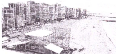
PALCO já sendo montado para receber o show Natal de Todos

A Prefeitura de Fortaleza divulgou o plano operacional para o Réveillon 2023 nesta quarta-feira, 21. A programação conta com 18 atrações em dois dias de festa. Entre as novidades, a virada terá tarifa zero entre as 16 horas de sábado, 31, e 5 horas de domingo, 1º, e um corredor exclusivo para pedestres na avenida Rui Barbosa, entre as avenidas Historiador Raimundo Girão e a rua Tenente Benevolo.