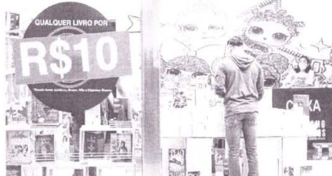
NOVA lei visa facilitar o acesso ao crédito aos pequenos empreendedores.

Estado do Ceará - Prefeitura Municipal de Cauazeiro - Arco de Lactação - Projeto Lei nº 001/2022 PE-SRP A Prefeitura Municipal de Cauazeiro CE, para melhorar o atendimento ao cidadão que se alimenta de leite materno, cria o Projeto Lei nº 001/2022 PE-SRP que institui o Programa de Simplificação do Crédito Digital (SIM DIGITAL) com juros subsidiado.