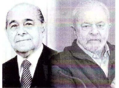
TANCREDO Neves e Lula: cenários que se assemelham

Eu alertava para suspiros radicais, mas não contava tudo. Veja: só duas antes de um comício fui informado de que um pistoleiro boliviano tinha sido contratado para matar em Goiânia. Foi ao evento, discursou e pedi que não se divulgasse o boato. Naquele dia foram presos mais quatro soldados colando cartazes contra mim. Mandei devolvê-los ao Exército.