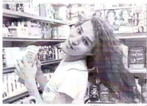
SOFIA foi morta no dia 11 de fevereiro passado

No dia 30 de março, uma mulher trans foi morta a tiros na Pacatuba. A vítima tinha 31 anos e foi encontrada em