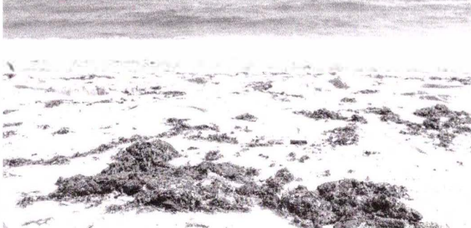
CERCA DE 64 PRAIAS do Estado haviam sido atingidas, até sexta-feira, 11

ALEXIA VIEIRA alexia.vieira@opovo.com.br