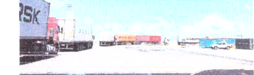
MOBILIZAÇÃO dos servidores da Receita Federal tem causado filas nas aduanas

ESTADO DO CEARÁ - PREFEITURA MUNICIPAL DE ACARAUÁ - ATA DE JULGAMENTO DOS DOCUMENTOS DE HABILITAÇÃO - TOMADA DE PREÇOS Nº 015/2022 - Objeto: "Prestação de serviços de manutenção e conservação de equipamentos de informática, incluindo a aquisição de peças e materiais necessários para a execução dos serviços, bem como a realização de cursos de capacitação para os servidores públicos, visando à melhoria da qualidade dos serviços prestados".