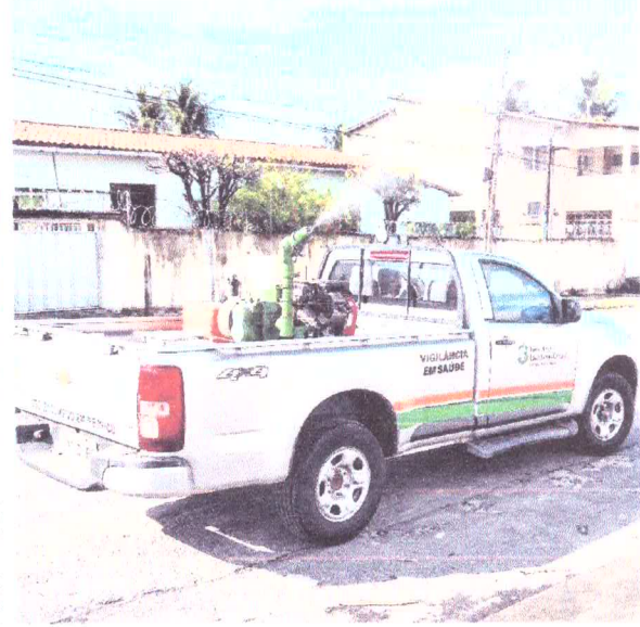
OPERAÇÃO Fumacê no bairro Cidade dos Funcionários, em Fortaleza

PREFEITURA MUNICIPAL DE MULUNGU (CE) Toda a cidade que recebeu o Superintendente Estadual de Meio Ambiente (SEMMA) e a Agência de Inspeção e Defesa (AID) para fiscalização do Centro Cultural, em Fortaleza, Rua Tereza, José Freixo, Centro, Fortaleza, Ceará, CEP: 60010-000, em Fortaleza, Ceará, em 2022. Toda a cidade que recebeu o Superintendente Estadual de Meio Ambiente (SEMMA) e a Agência de Inspeção e Defesa (AID) para fiscalização do Centro Cultural, em Fortaleza, Rua Tereza, José Freixo, Centro, Fortaleza, Ceará, CEP: 60010-000, em Fortaleza, Ceará, em 2022.