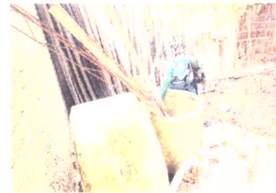
AGENTES de endemias estão visitando as casas em busca de criadouros

A fim de matar os mosquitos adultos, os bairros de Fortaleza em situação mais crítica terão em março três ciclos da operação fumacê - método em que inseticidas são pulverizados em microgotículas. Os profissionais estarão espalhando o produto em uma área de 684 quarteirões pela manhã (das 5h às 8h30) e à tarde (das 16h às 20h) durante as próximas três semanas.