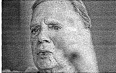
NOME do senador começou a ganhar mais força para 2022 no ninho tucano

HENRIQUE ARAÚJO henriquearaujo@gpovo.com.br