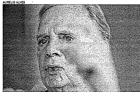
NOME do senador começou a ganhar mais força para 2022 no ninho tucano

HENRIQUE ARAÚJO henriquearaujo@opovo.com.br