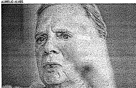
NOME do senador começou a ganhar mais força para 2022 no ninho tucano