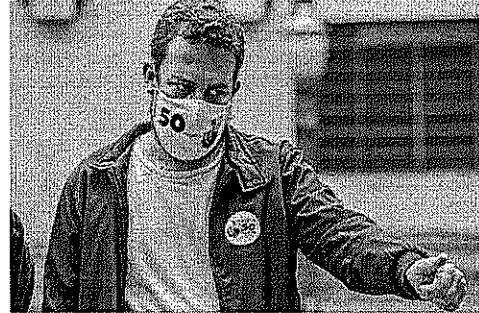
INTIMADO pela PF, Boulos terá que se apresentar na superintendência da PF em São Paulo no dia 29

O tuíte de Boulos se deu na esteira de uma declaração dada pelo presidente Jair Bolsonaro (sem partido) um dia após ato antidemocrático em frente ao Quartel General do Exército, com faixas contra o Congresso e o Supremo Tribunal Federal (STF). Na ocasião, Bolsonaro afirmou: "O pessoal geralmente conspira para chegar no poder. Eu já estou no poder. Eu já sou o presidente da República". Em outro momento, completou: "Eu sou realmente a Constituição".