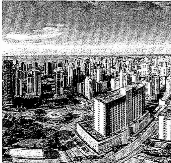
MERCADO IMOBILIÁRIO é um dos que devem sofrer com inadimplência