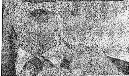
CIRO GOMES acha que perdeu porque o associam ao PT