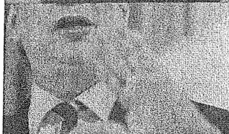
CIRO GOMES acha que perdeu porque o associam ao PT